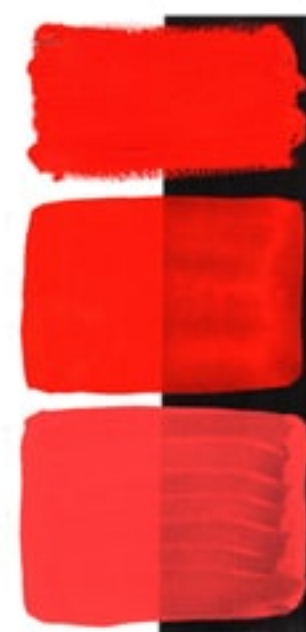
Pyrrol Scarlet Available in 15ml I • 3 • ● • Series 3 PR 255