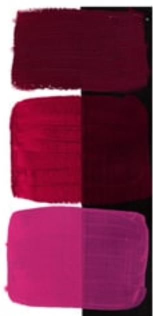
Quinacridone Magenta Available in 15ml II • 3 • ● • Series 2 PR 122