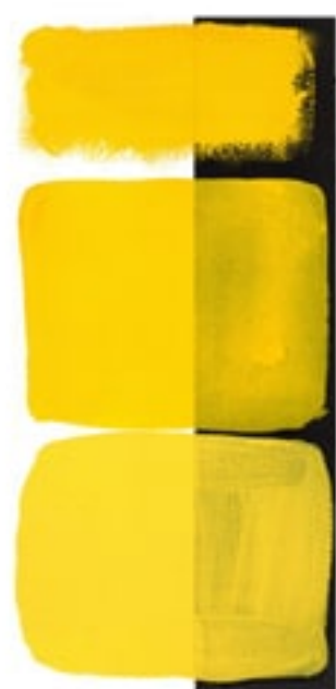
Hansa Yellow Med. Available in 15ml II • 2 • ● • Series 2 PY74 2GX70