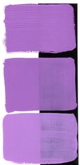
Wisteria Available in 15ml II • 1 • ● • Series 2 PW 6, PR 122