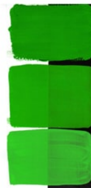
Permanent Green Light Available in 15ml I • 2 • ● • Series 1 PY 3, PG 7