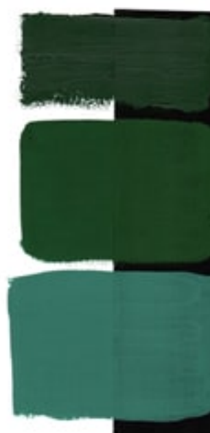
Cascade Green Available in 15ml I • 3 • ● • Series 1 PBr 7, PB 15