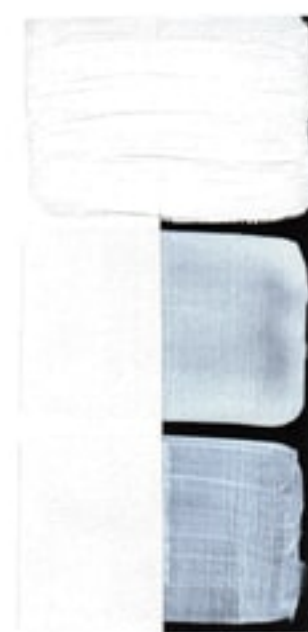
Titanium White Available in 15ml I • 1 • ● • Series 1 PW 6

GOUACHE swatches are painted in three sections across black and white surfaces. The top is mass tone straight from the tube; middle is 1:1 paint and water; bottom is 1:1:1 paint, water and Titanium White