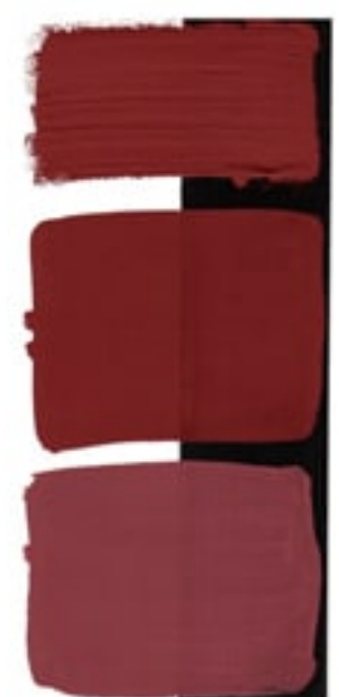
Indian Red Available in 15ml I • 3 • ● • Series 1 PR 101