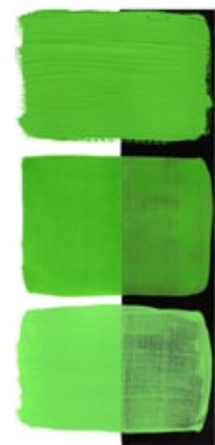
Spring Green Available in 15ml I • 2 • ● • Series 3 PY 53, PG 36, PY 151