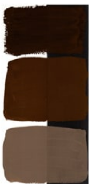
Burnt Umber Available in 15ml I • 2 • ● • Series 1 PBr 7