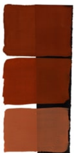
Burnt Sienna Available in 15ml I • 1 • ● • Series 1 PBr 7