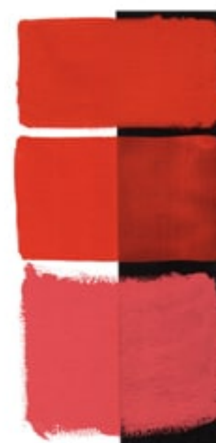
Pyrrol Red Available in 15ml I • 3 • ● • Series 3 PR 254