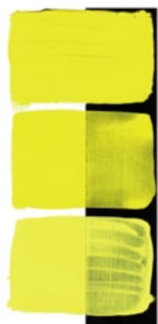
Hansa Yellow Light Available in 15ml I • 2 • ● • Series 1 PY 3