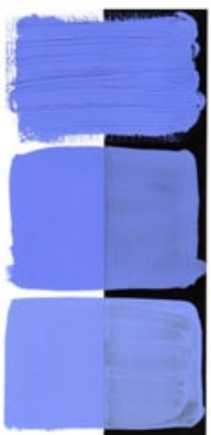
Lavender Available in 15ml I • 2 • ● • Series 2 PW 6, PV 15, PB 29