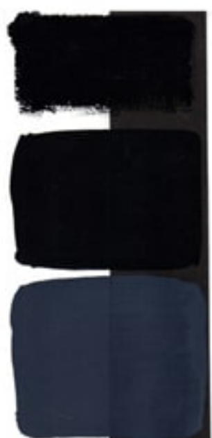
Lamp Black Available in 15ml I • 4 • ● • Series 1 PBk 6