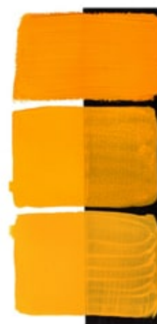
Hansa Yellow Deep Available in 15ml II • 2 • ● • Series 1 PY 65