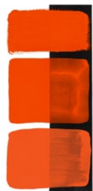
Pyrrol Orange Available in 15ml II • 3 • ● • Series 2 PO 73