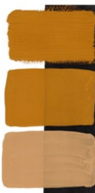
Yellow Ochre Available in 15ml I • 1 • ● • Series 1 PY 43