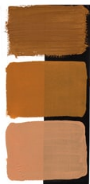
Raw Sienna Available in 15ml I • 2 • ● • Series 1 PBr 7