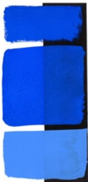
Ultramarine Blue Available in 15ml I • 3 • ● • Series 1 PB 29